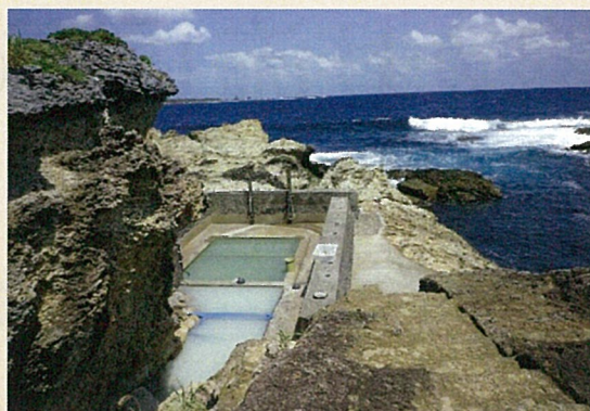
小宝島 海中温泉 (鹿児島県)