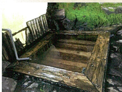
旭岳温泉 湧駒荘 (北海道)