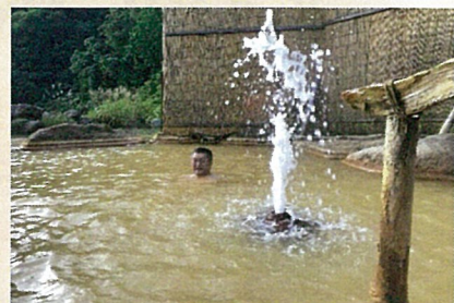
広河原温泉 湯の華 (山形県)